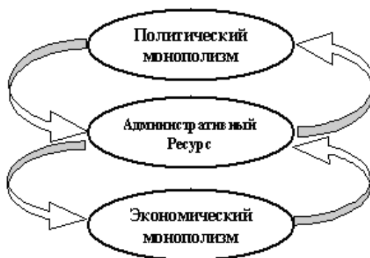
Рис. 1. Схема развития систем общественного устройства

экономическая сферы втягиваются друг в друга. Отсутствие в России действенных нормативно-правовых и иных ров деятельности политиков приводит к дальнейшему повышению роли стративного ресурса, связывающего политическую и экономическую системы (рис. 1) [5].